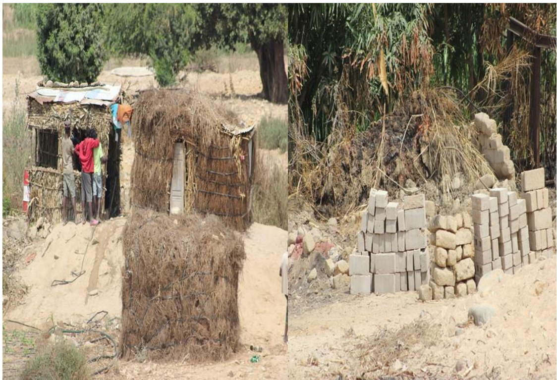
Construção de residências precárias, queimada, lavagem de adobes e deposição de blocos de cimento na área estuarina do Giraul.