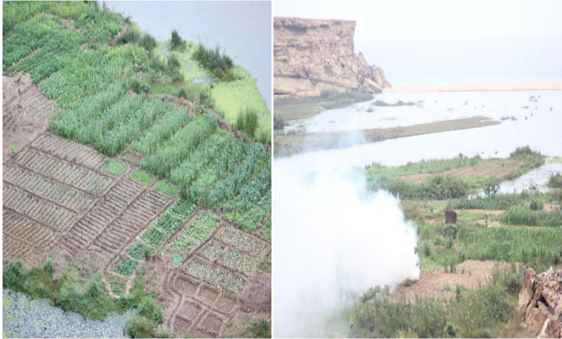
Agricultura insustentável e queimada na área estuarina do Giraul.