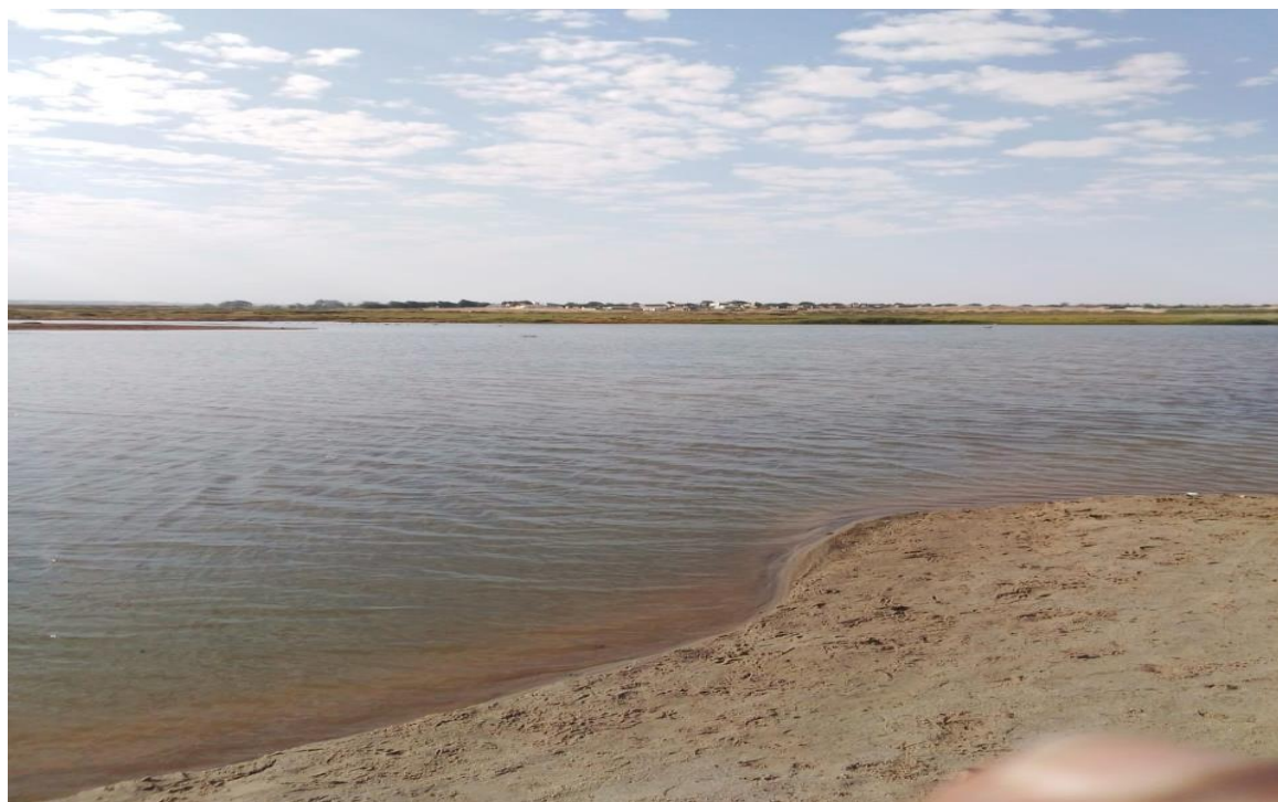
Figura 6: Pormenor do estuário do Curoca e sua área estuarina.

enchentes do rio a água vaza para o mar principalmente nos pontos 15°42'09"S, 11°54'07"E e 15°43'06"S, 11°54'05"E. Devido ao plano inclinado que existe neste estuário, o ponto principal de drenagem da água fluvial para o mar situa-se nas coordenadas topográficas 15°42'09"S e 11°54'07"E (Da Silva, 2018).