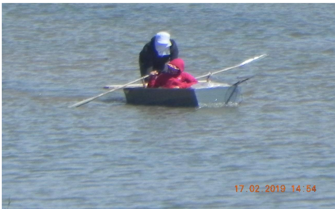
Pescadores furtivos de nacionalidade vietnamita a pescar na lagoa estuarina do Giraul.