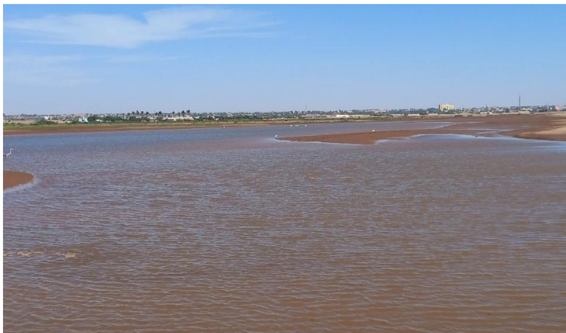
Figura 2: Pormenor do estuário do rio Bero, época chuvosa.