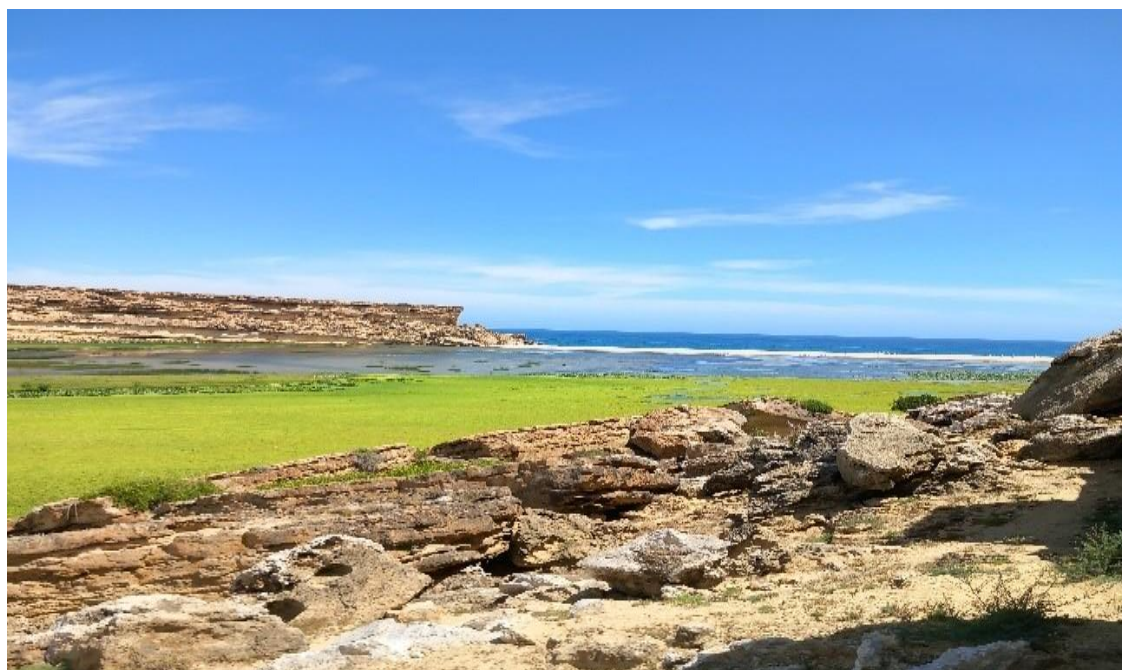
Figura 4: Pormenor do estuário e área estuarina do Giraul, época não chuvosa

Quanto às características da costa e a sua variabilidade regional este estuário classifica-se como sendo uma laguna estuarina devido ao acesso restrito ou efêmero da água do rio ao mar através de um único assoreamento dos canais de acesso ao mar pelo transporte de sedimentos marinhos e a falta de pressão hídrica das águas do rio (Da Silva, 2018 citado por Tchicuaquili, 2019).