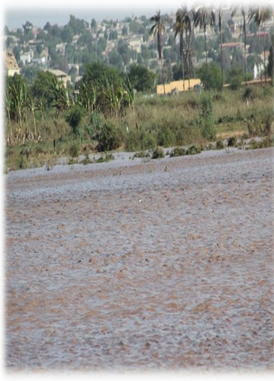
Estuário do Curoca “Pinda-Paiva” e Bero durante o tempo chuvoso