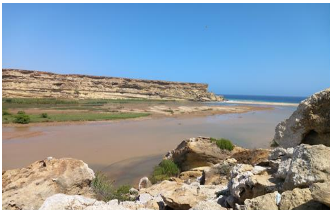
Figura 7: Pormenor do estuário do Giraul e sua área estuarina, época chuvosa.

Este estuário se fecha ao mar por uma barreira de areias depositadas que se posicionam nos pontos 15°03'09''S,12°08'03''E à Norte e 15°04'02''S,12°08'03''E a Sul, ambos do lado da lagoa, para 15°04'06''S,12°08'03''E no extremo Norte e 15°04'02''S,12°08'03''E no extremo Sul do lado do mar. A ligeira elevação que se observa do lado norte da barreira de encerramento resulta da acumulação da areia durante o tempo que o estuário não recebe consideráveis quantidade se água doce e provoca uma inclinação do norte a sul que faz com que quando há grande pressão hídrica fluvial o estuário se abre e a água vaza para o mar nas coordenadas 15°04'01''S,12°08'03''E e 15°04'02''S,12°08'03''E (Da Silva, 2018).