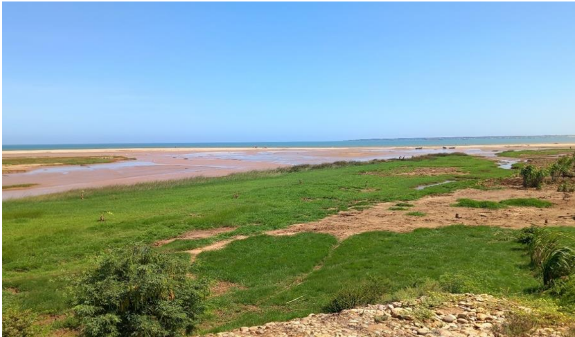
Figura 5: Pormenor do estuário do Bero e sua área estuarina, época chuvosa.